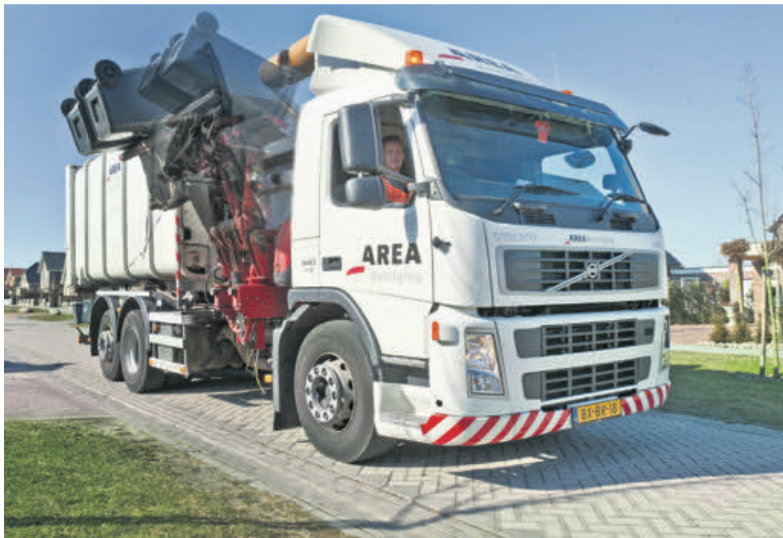
Area zorgt in Emmen, Coevorden en Hoogeveen voor duurzame afvalinzameling.

Area Reiniging heeft een eigen afvalkenniscentrum van waaruit de veranderingen in de afvalinzameling in verschillende gemeenten worden voorbereid en gemanaged. 'We halen steeds meer verschillende soorten huishoudelijk afval op. Op dit moment hebben de inwoners van Emmen bijvoorbeeld een nieuwe restafvalcontainer ontvangen. De oude container krijgt een PMD-sticker en doet voortaan dienst als container voor plastic en metalen verpakkingen en dranken-