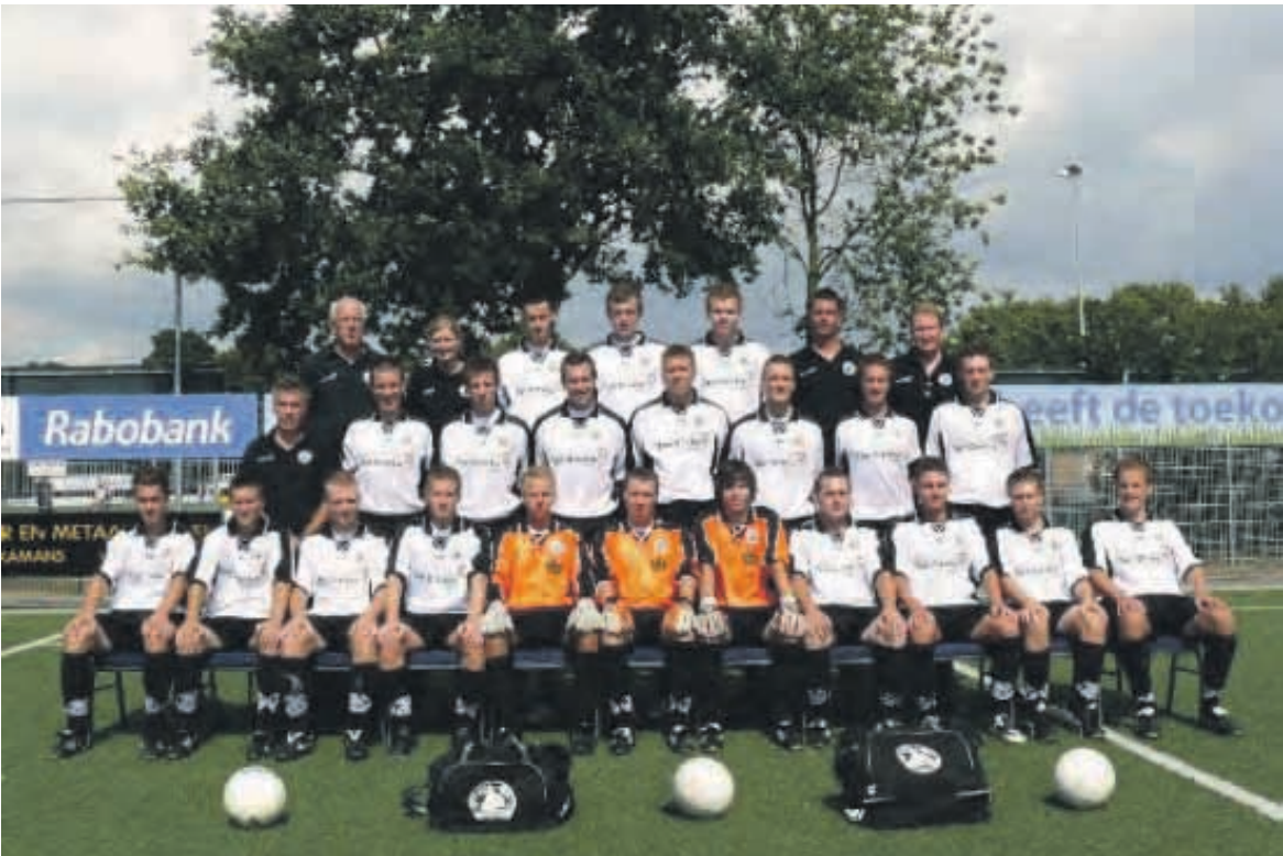
De selectie van zaterdag derde klasser Enter Vooruit.