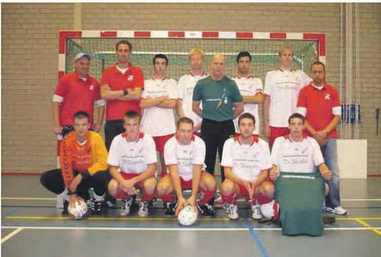
De zaalvoetballers van Dalen.