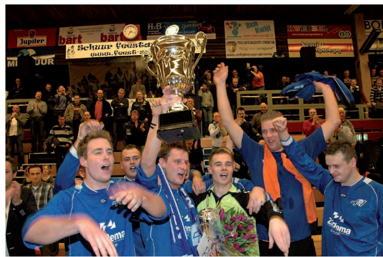
Hoogeveen gaat op 10 januari 2010 uit zijn bol. Zojuist is de finale tegen streekrijaal HODO met 8-6 gewonnen.