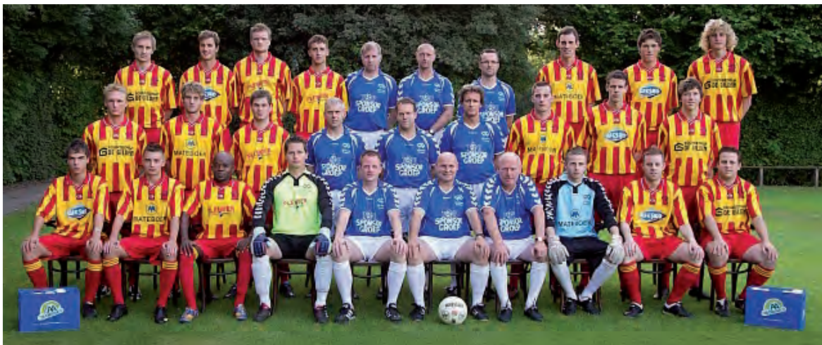
De A-selectie van Go Ahead Kampen, subtopper in 1D (Oost).

Go Ahead Kampen neemt opnieuw deel aan 'Protos-Weering'. In poule B treffen de 'Kohetters' SCD'83 (Dedemsvaart), Dedemsvaart, Nieuwleusen en Vitesse'63 (Koekange). Plaats van handeling op maandag 27 december is sporthal De Citadel in Dedemsvaart.