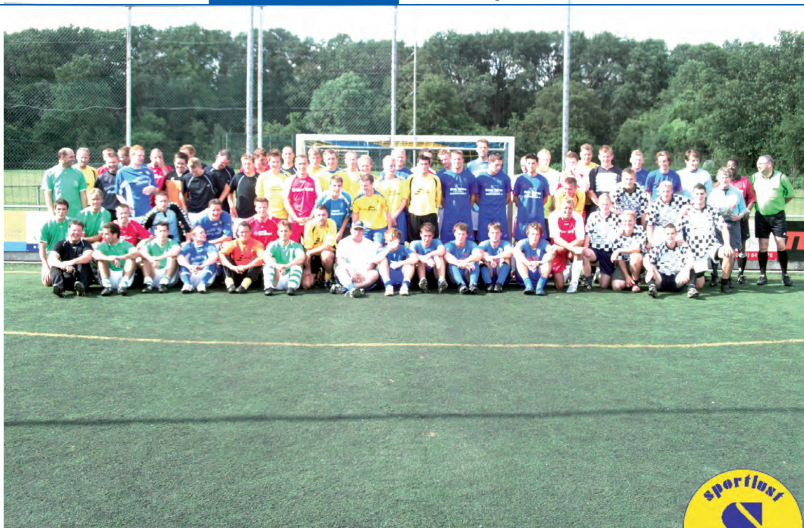
Alle finalisten van het Diekman Kunstgrastoernooi 2010.