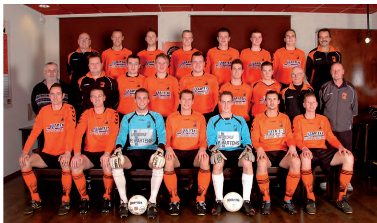
De voetbalselectie van Hollandscheveld, dat al jaren door het autobedrijf van de familie Martens wordt gesponsord.